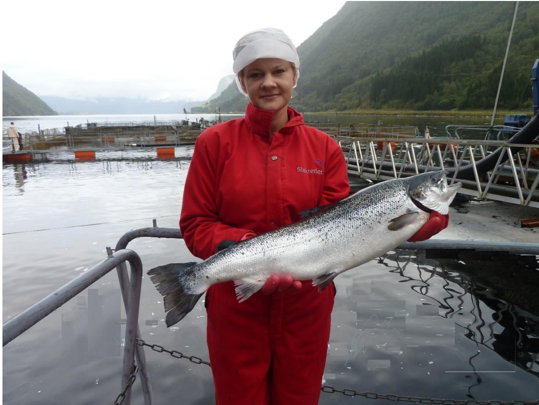
Flott laks oppdrettet i Vadheimsfjorden

Bruk av Aller Active med mineralingrediens i fôr til laksefisk